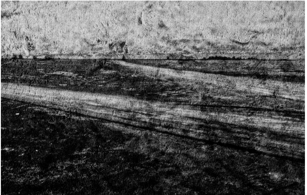
Lucas K. Doolan, Coastal Landscape Nr.1, 2022, Archival Pigment Print, (60 x 80 cm)